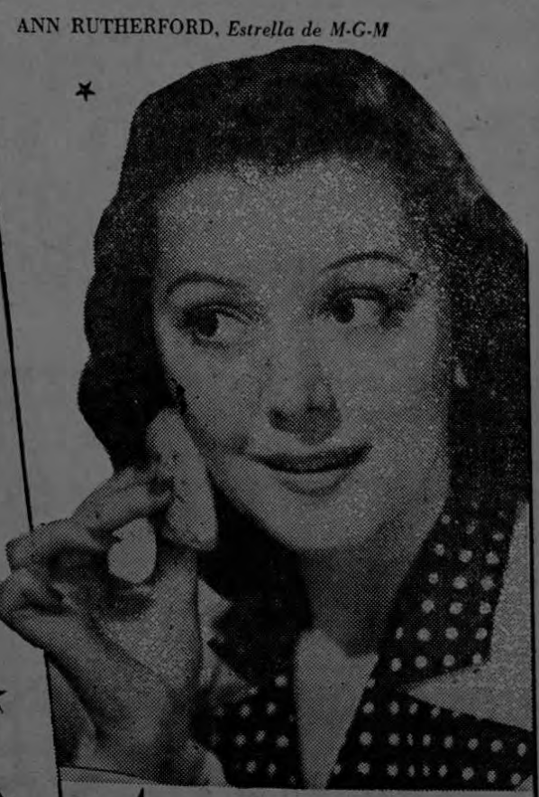
ANN RUTHERFORD, Estrella de M-G-M

Es ELEGANTE, moderno, distinto . . . Un maquillaje nuevo creado por Max Factor * Hollywood. Da el efecto "glamuroso" que presenta la tez de las estrellas de la pantalla. Disimula simples defectos del cutis, y se conserva bien adherido indefinidamente sin necesidad de retocarse. Introducido en las películas Tecnicolor, el Pan-Cake es la última novedad de Hollywood, en maquillaje.